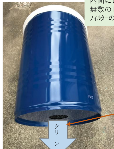
驚くほど 透明に近い クリーン度