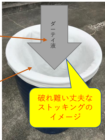
破れ難い丈夫な ストックのイメージ